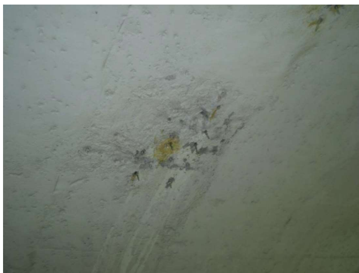
Figura 5 - Abóbada sala de válvulas – Resultados após 13 meses das injeções