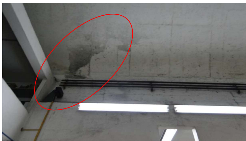
Figura 3 - abóbada da sala de válvulas – infiltrações