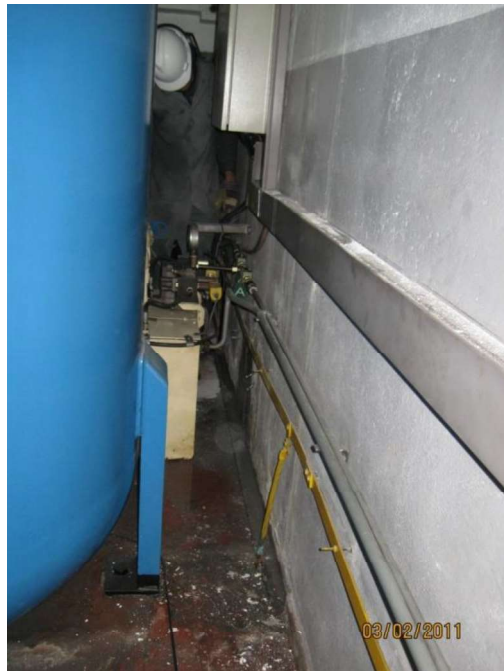
Figura 4 - Parede atrás dos acumuladores - presença de umidade e infiltrações

A parede atrás dos acumuladores (Figura 4) é um local de difícil acesso, com muitos cabos e dutos. A presença de água perto de equipamentos eletromecânicos é indesejada e pode acarretar falhas de operação. Este motivo torna ainda mais importante a recuperação desta área de infiltração.