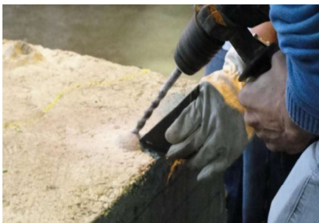
Figura 2 - Gabarito de madeira para auxiliar no ângulo de perfuração (POLUCHA, A. C.; RAIN, L. S.; MORO, M. L., MEDEIROS, M.H.F, 2011).

As resinas de poliuretano são fornecidas em duas embalagens separadas, uma contendo a base e a outra o endurecedor. Antes que a injeção seja iniciada, é imprescindível que os componentes sejam misturados cuidadosamente utilizando furadeira elétrica de baixa rotação com pás misturadoras ou com uma espátula. Depois de misturados, a resina deve ser transferida para um segundo recipiente para garantir que o material no fundo do frasco não fique mal misturado.