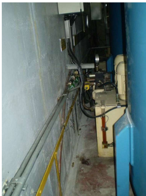
Figura 6 - parede atrás dos acumuladores - Resultado após 5 meses

As principais dificuldades encontradas nesta região foram o pouco espaço para se trabalhar atrás dos equipamentos e a presença de cabos, dutos e equipamentos eletromecânicos na parede tratada. Mesmo com a dificuldade de acesso para aplicação da resina, a parede atrás dos acumuladores se apresentava seca. Nesta região, não ocorreu reincidência de percolação de água. Com o tratamento efetuado, foi possível realizar o selamento flexível de fissuras e falhas de concretagem, acabando com a percolação de água e presença de umidade. O resultado do tratamento, após 5 meses, está apresentado na Figura 6, onde pode-se observar que a parede e o piso estão secos.