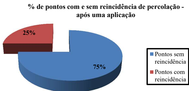
Figura 7 - Gráfico de percentual de reincidência de umidade nas áreas após uma aplicação

Após 8 meses desde os primeiros serviços de injeções, foi constatado, durante as vistorias em campo, que os pontos de difícil acesso não apresentaram reincidência de percolação, enquanto alguns pontos de fácil acesso apresentaram. A Figura 7 apresenta o percentual das áreas com reincidência de infiltração de água após uma etapa de injeção.